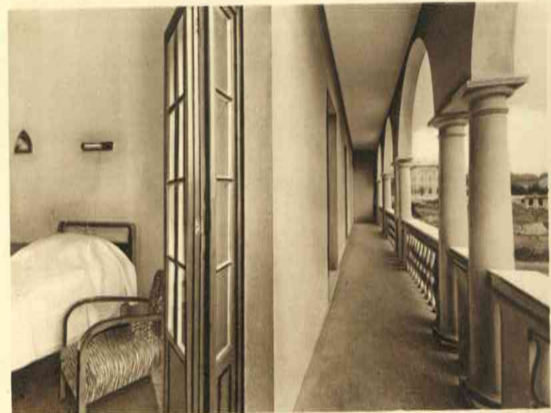
Camere con bagno

Riscaldamento centrale - Acqua corrente calda e fredda - 40 bagni privati - Ascensori - Telefoni - Ristorante - Bar - Sale di lettura - Verande e terrazze al sole - Giardino - Servizio religioso - Servizio medico permanente.