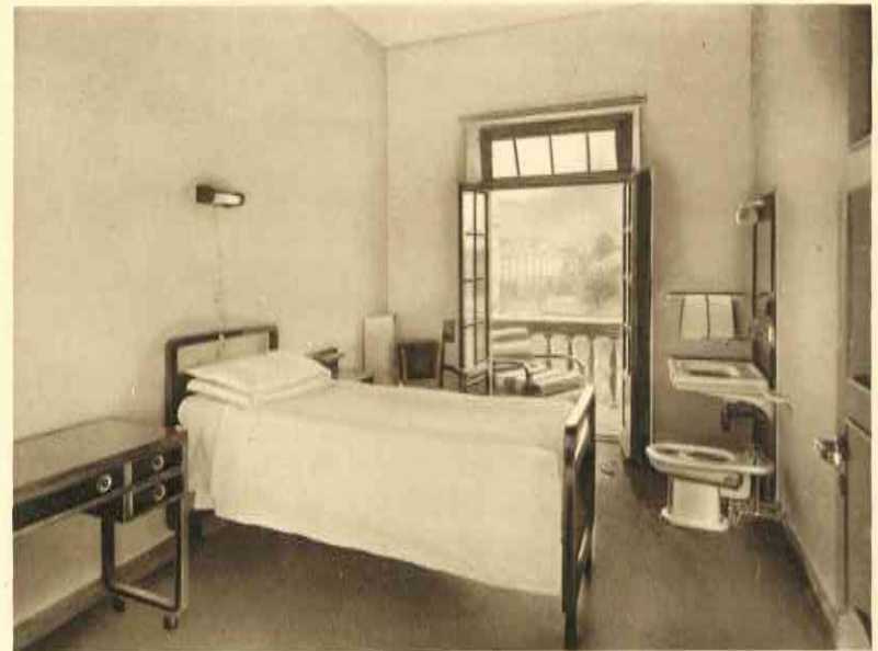
Camere di 2ª. categoria

Chirurgia generale - Ginecologia - Ostetricia - Otorinolaringoiatria - Ortopedia - Oculistica - Urologia - Cardiologia - Medicina interna ( escluse le malattie infettive e mentali ) - Radiologia - Cure fisiche - Regimi dietetici - Soggiorni di convalescenza e di riposo - Libera scelta del proprio medico.