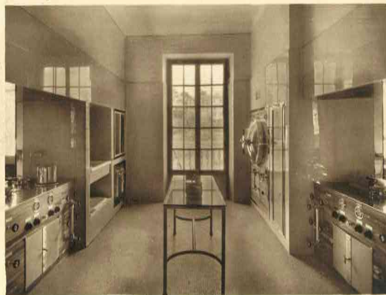
Sale di sterilizzazione