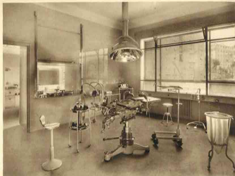
Una sala operatoria