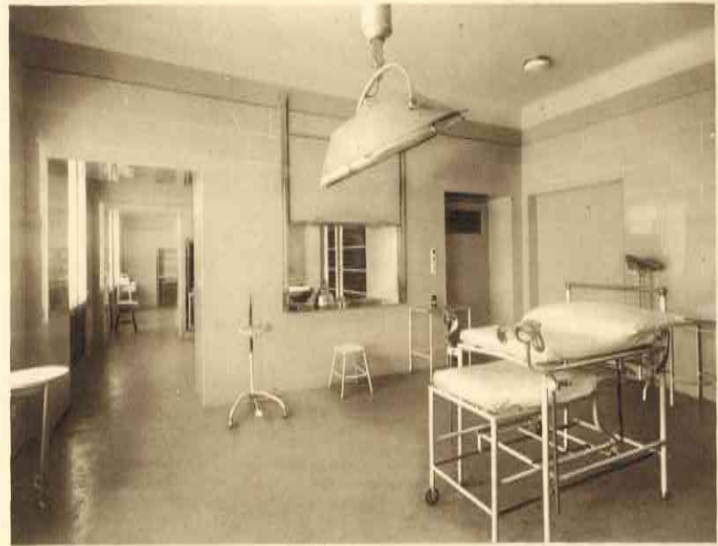
Sale da parto